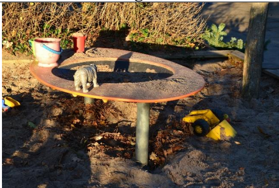
Redskab: Sandbord Årgang: Producent: Er redskabet mærket: Nej Er der registreret fejl/mangler: Nej