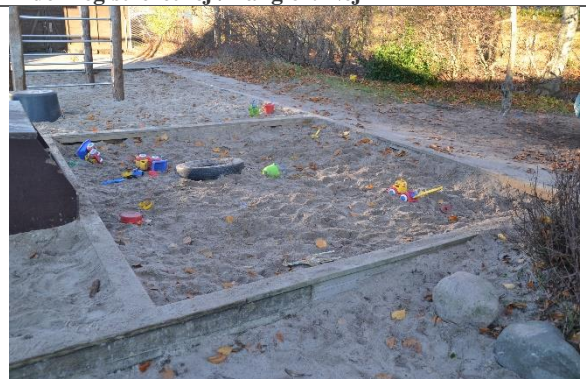
Redskab: Sandkasse Årgang: Producent: Er redskabet mærket: Nej Er der registreret fejl/mangler: Nej