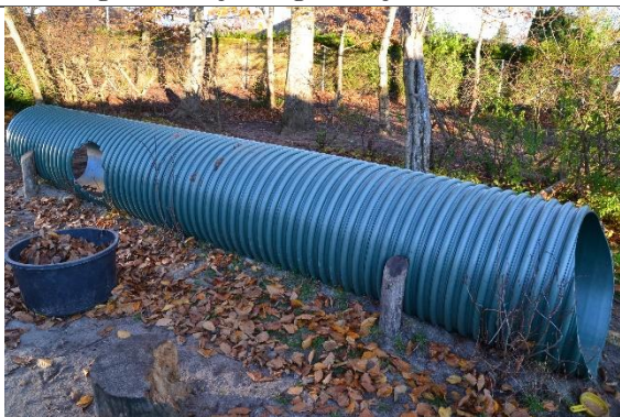
Redskab: Tunnel Årgang: Producent: Er redskabet mærket: Nej Er der registreret fejl/mangler: Nej