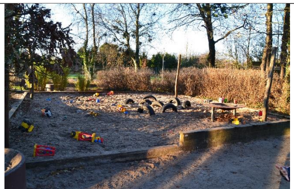
Redskab: Sandkasse med stolper til læsejl Årgang: 2010 Producent: Er redskabet mærket: Ja Er der registreret fejl/mangler: Nej