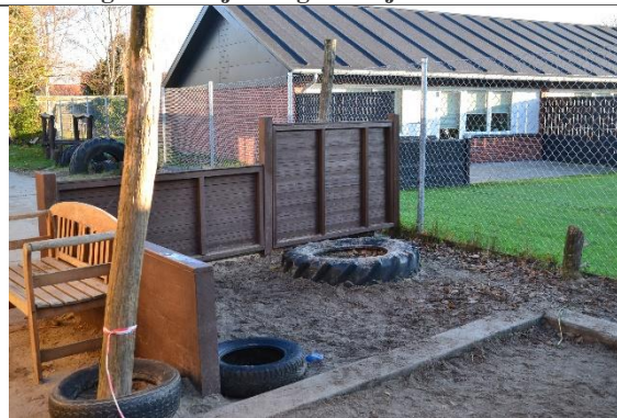
Redskab: Sandkasse med stolper til læsejl Årgang: Producent: Er redskabet mærket: Nej Er der registreret fejl/mangler: Ja