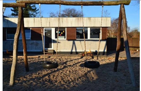
Redskab: Gyngestativ Årgang: 2011 Producent: Danske Legepladser Er redskabet mærket: Ja Er der registreret fejl/mangler: Ja