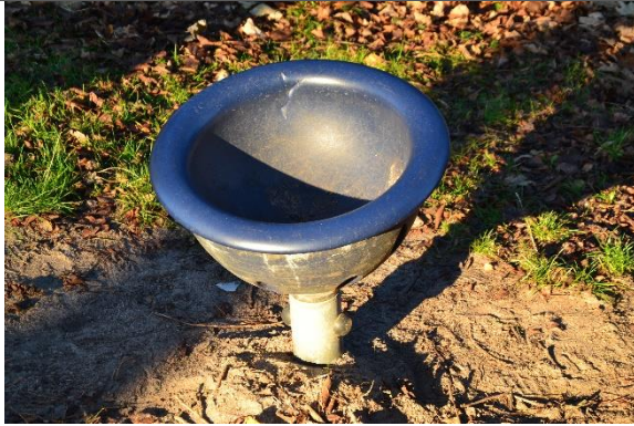
Redskab: Tekop Årgang: 2007 Producent: Kompan Er redskabet mærket: Ja Er der registreret fejl/mangler: Nej