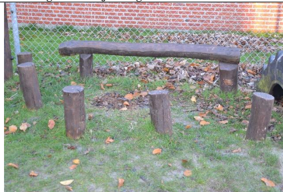
Redskab: Balanceforløb Årgang: 2011 Producent: Danske Legepladser Er redskabet mærket: Ja Er der registreret fejl/mangler: Nej