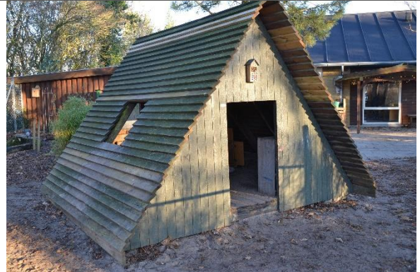
Redskab: Legehus Årgang: 2007 Producent: Er redskabet mærket: Ja Er der registreret fejl/mangler: Nej