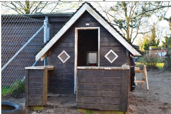
Redskab: Legehus Årgang: 2016 Producent: Er redskabet mærket: Ja Er der registreret fejl/mangler: Ja