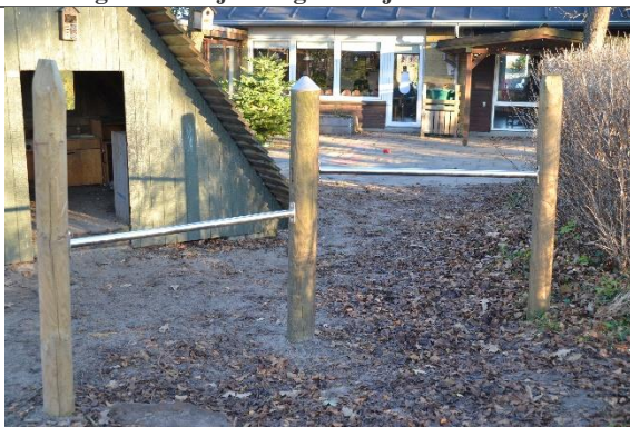
Redskab: Svingbom Årgang: Producent: Er redskabet mærket: Nej Er der registreret fejl/mangler: Nej