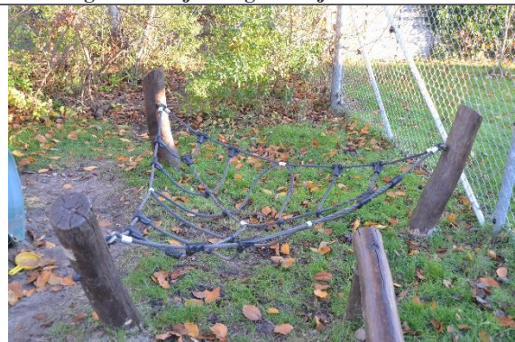
Redskab: Klatrenet Årgang: 2011 Producent: Danske Legepladser Er redskabet mærket: Ja Er der registreret fejl/mangler: Nej