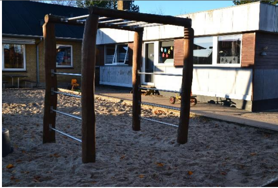
Redskab: Klatrestativ Årgang: 2011 Producent: Danske Legepladser Er redskabet mærket: Ja Er der registreret fejl/mangler: Nej