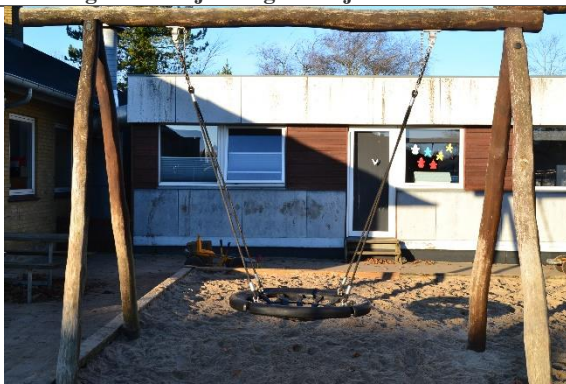
Redskab: Fugleredegynge Årgang: 2011 Producent: Danske Legepladser Er redskabet mærket: Ja Er der registreret fejl/mangler: Nej