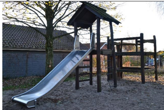
Redskab: Klatrestativ med rutsjebane Årgang: Producent: Er redskabet mærket: Nej Er der registreret fejl/mangler: Nej