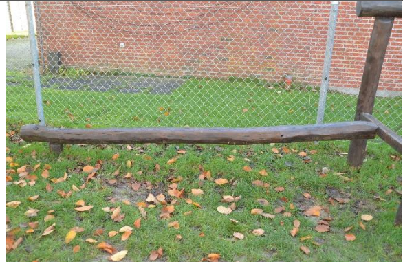
Redskab: Balancestolpe Årgang: 2011 Producent: Danske Legepladser Er redskabet mærket: Ja Er der registreret fejl/mangler: Nej