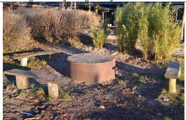
Redskab: Bålsted Ikke omfattet af DS/EN 1176