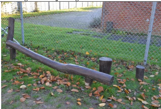
Redskab: Skrå balancestolpe Årgang: 2011 Producent: Danske Legepladser Er redskabet mærket: Ja Er der registreret fejl/mangler: Nej