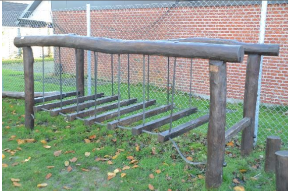
Redskab: Hængebro Årgang: 2011 Producent: Danske Legepladser Er redskabet mærket: Ja Er der registreret fejl/mangler: Ja